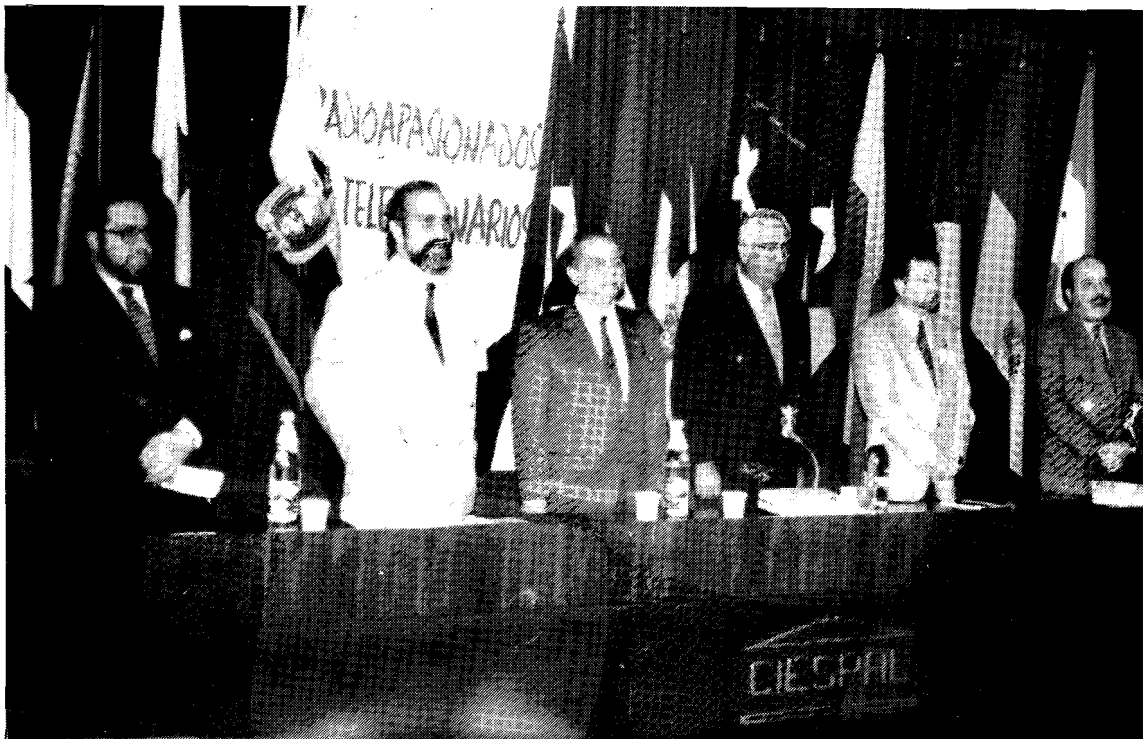
Mesa directiva en la sesión inaugural