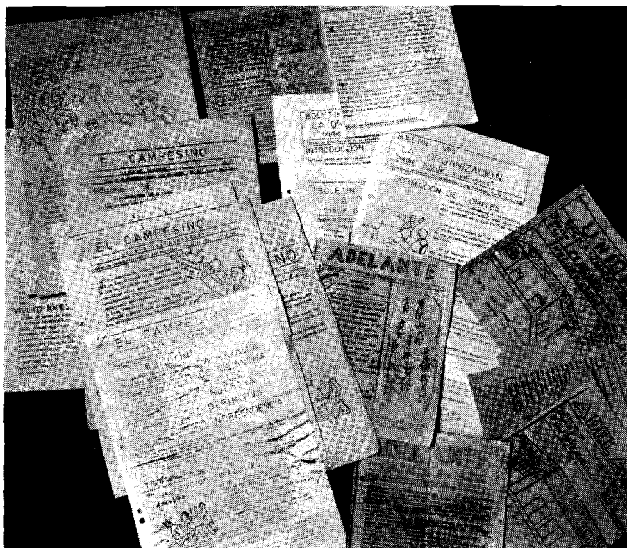
Materiales producidos en los talleres de comunicación

unión y la integración de un comité de vialidad.