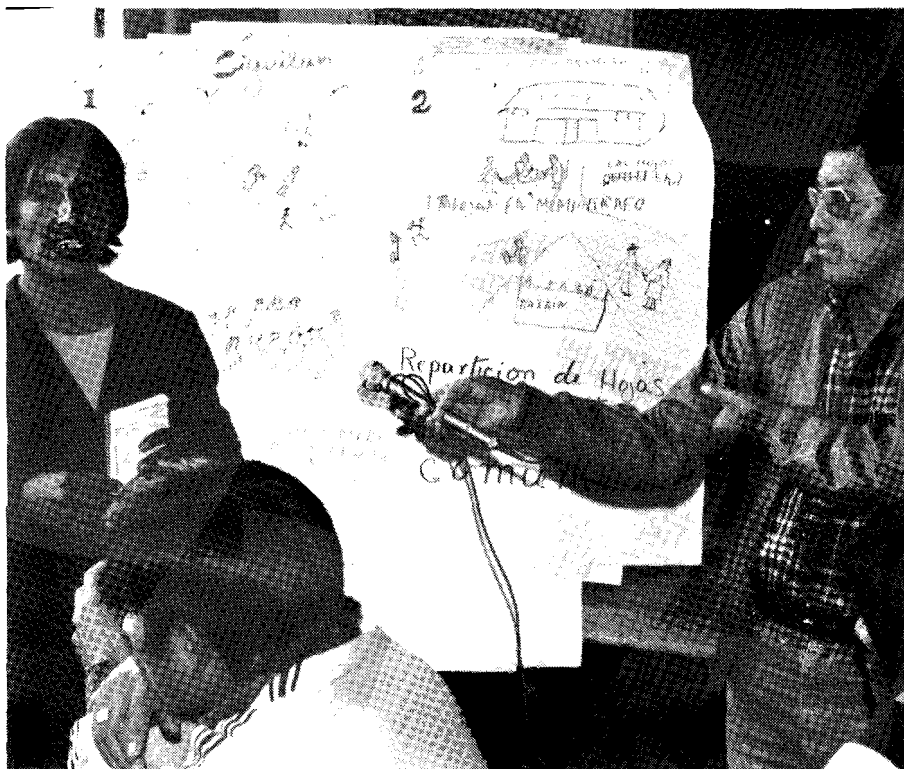
Los talleres de comunicación utilizan diversos medios para analizar colectivamente sus problemas en busca de soluciones concretas.

Durante los tres años de la ejecución del Proyecto en las cinco comunidades rurales, se han aplicado diversas modalidades de investigación participativa, de acuerdo con las condiciones específicas de cada parcialidad. Los niveles de complejidad de los problemas y, las nuevas exigencias teóricas y metodológicas. Así mismo, se han detectado di-