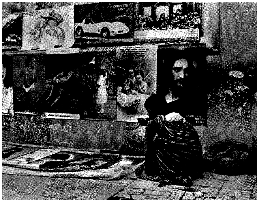
Jesus Carlos, Imagen Latina