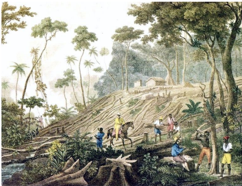
Figura 2. Negros escravizados derrubam de uma floresta da Mata Atlântica (1820-1825). Por Johann Moritz Rugendas