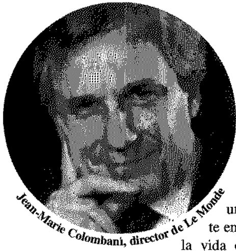
Jean-Marie Colombani, director de Le Monde

No se trata de una polémica entre periodistas, aseguran los autores del libro, el diario Le Monde ocupa un lugar tan importante en el funcionamiento y la vida de la república que puede aterrorizar a los políticos, inquietar a los responsables de la economía e intimidar a los editores, intelectuales y sindicalistas.