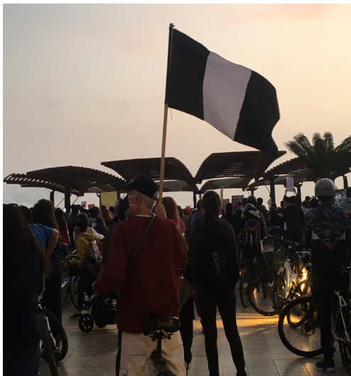
Figura 6. Ciudadano adulto mayor flameando la blanquinegra en la concentración en Miraflores