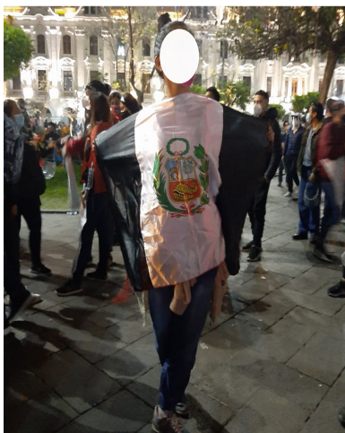
Figura 7. Ciudadana mostrando bandera blanquinegra