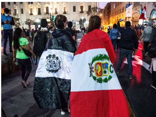
Figura 5. Jóvenes mujeres muestran mostrando el contraste de banderas en las marchas de noviembre de 2021