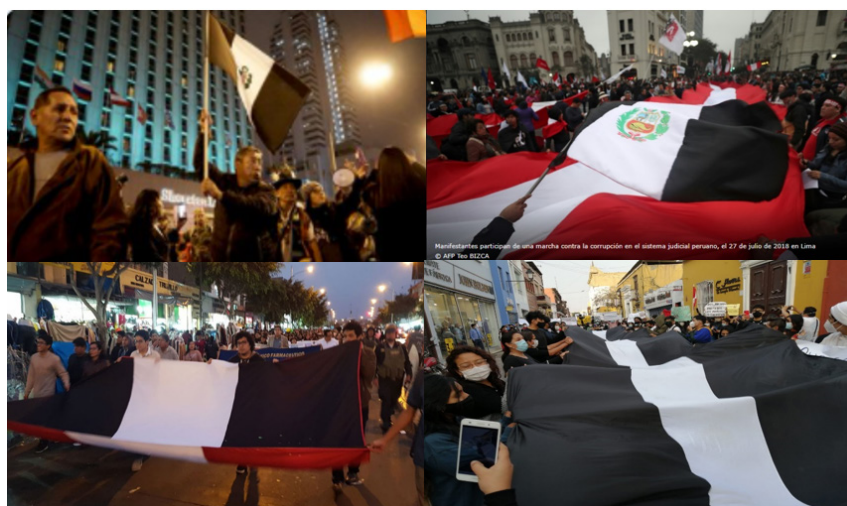
Figura 3. Manifestaciones con la blanquinegra