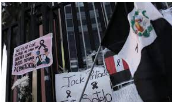
Figura 8. Bandera blanquinegra en protesta contra caso de Jordan Inti Sotelo Camargo y Jack Bryan Pintado