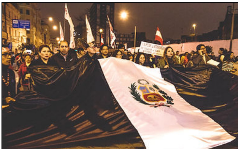
Figura 2. La bandera blanquinegra