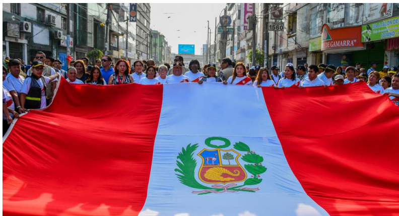
Figura 1. La bandera blanquirroja