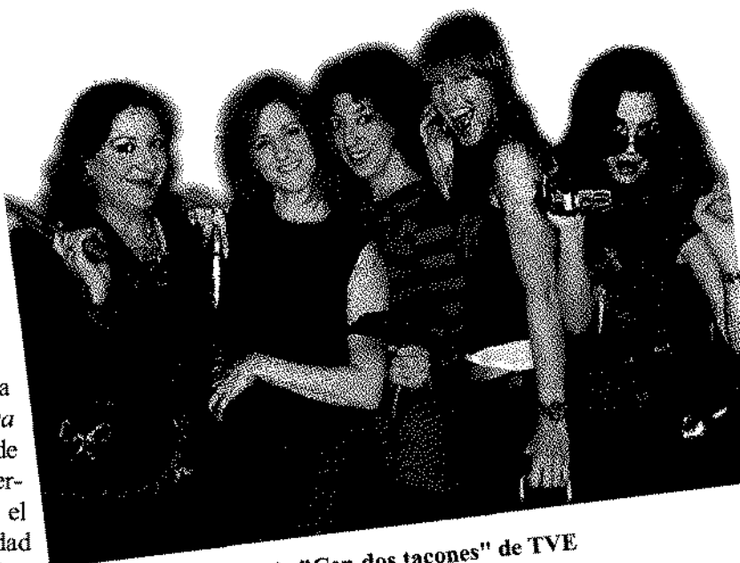
Serie "Con dos tacones" de TVE

Abuela de verano (2005), adaptación de la novela de Rosa Regàs, refleja cómo las nuevas situaciones familiares y laborales provocan que las abuelas se encarguen de los nietos, dando lugar a lo que se ha definido "el síndrome de la abuela eselava", un tema con gran repercusión en España y relacionado con el alargamiento de las jornadas laborales y la dificultad para hacerse cargo de los hijos.