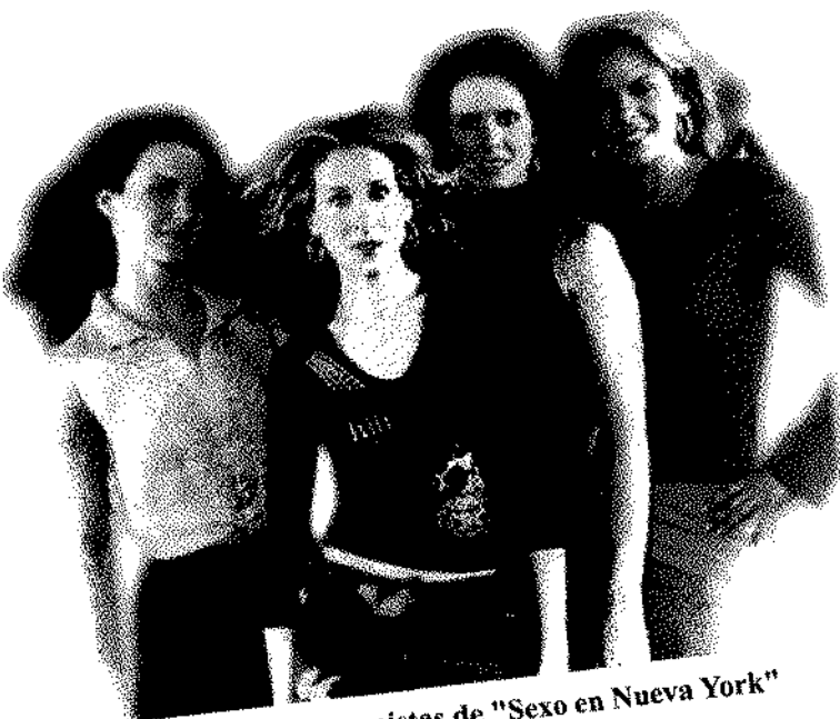
Protagonistas de "Sexo en Nueva York"

La ficción, además de servir de entretenimiento, presenta modelos de identificación que son imitados y tienden a fomentar y a enraizar, aún más, representaciones estereotipadas. Los estudios de género pueden ayudar a prevenir estas representaciones negativas en favor de la igualdad. ❁