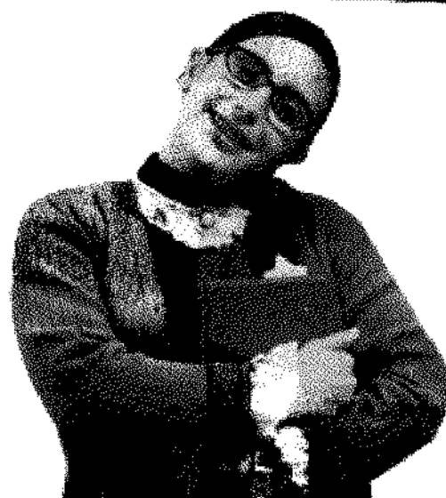
Betty la fea conmueve en todas sus versiones