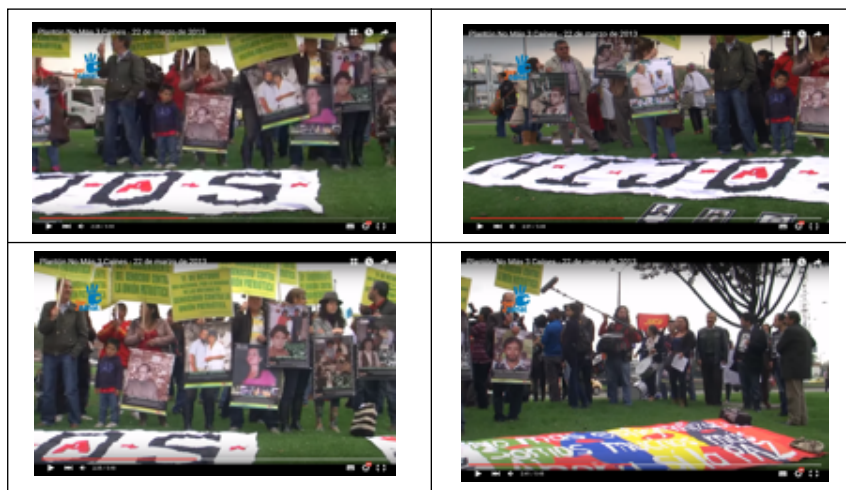
Secuencia 2. La consigna. Vídeo “Plantón No más Tres caínes” Fuente: (Tercer Canal, 2013 a) Intervalo temporal: 2:28-2:43

“¡Esta historia no me representa! ¡Los “Caínes” son una vergüenza! ¡Que respondan los de RCN! ¡¿Qué Colombia es la que quieren?!”