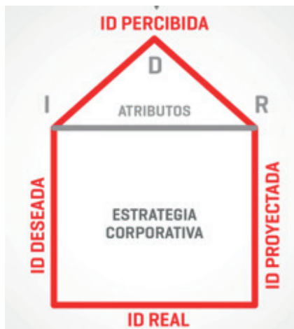
Figura 1. Modelo de análisis de la Identidad Corporativa

Modelo inspirado en Libaert (2005 y 2006), Capriotti (2009) y Riel (2012).